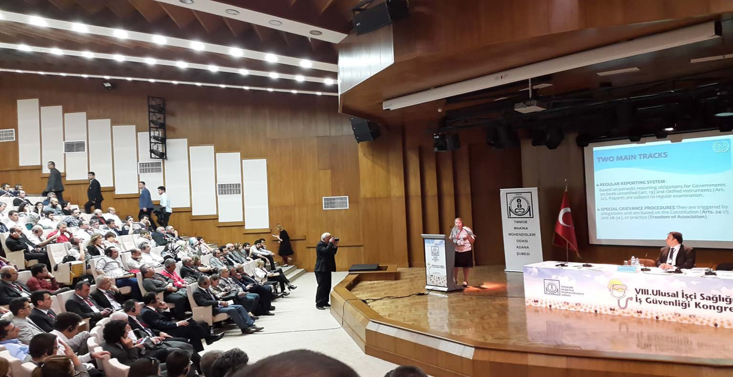
14-16 Nisan 2015 - TMMOB 8. İSG Adana Kongresi