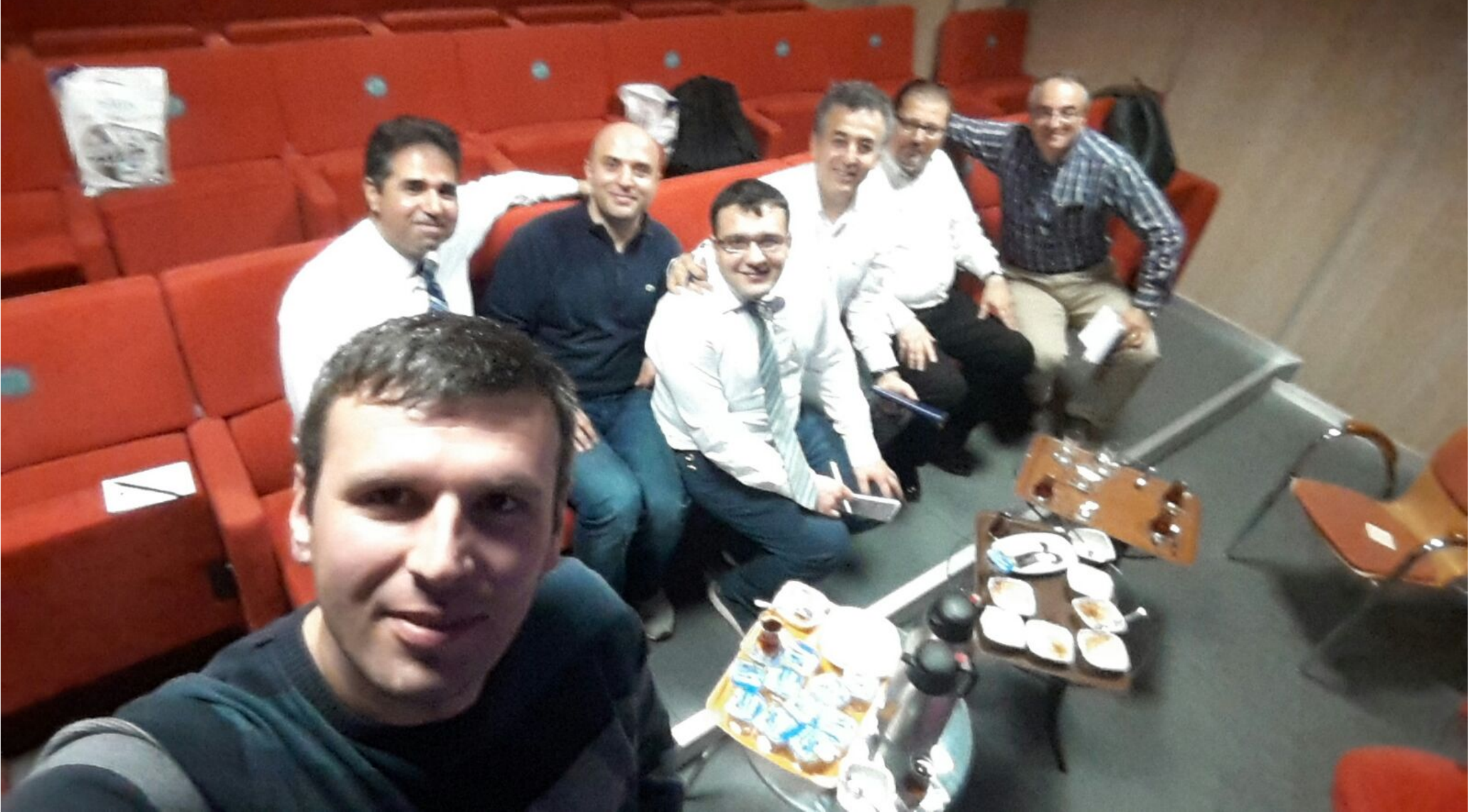
25 Kasım 2015 ÜNİSG Eğitim Grubu 2. toplantısı Şifa Üniversitesi